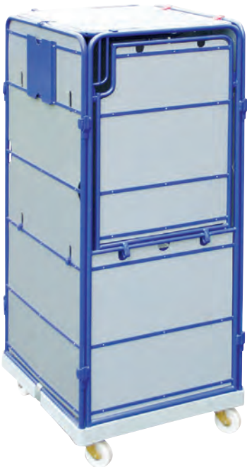
rolltainer® mit Außenverkleidung als Sicht-, Schutz- und Diebstahlschutz, Türen auf Vorderseite klapp- oder schwenkbar

Lieferbar in den Abmessungen: 695 x 810 mm, 760 x 810 mm, 780 x 790 mm • Klemmgitter: 1500 mm Nutzhöhe, wahlweise verschraubbare oder einhängbare Rückwand