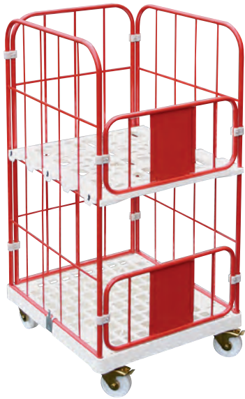
Verkaufsrollbehälter mit Preistafel als Vorderwand