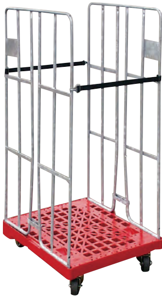
rolltainer® Sonderlösung 695 x 810 mm, 2-seitig, mit Klemmgitter