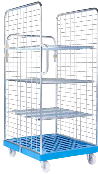
rolltainer® als Transportwagen mit variablen Zwischenböden und Sicher- heitsgriffen