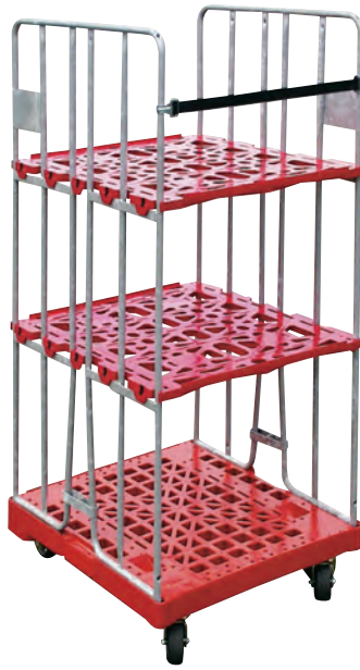
rolltainer® Sonderlösung 695 x 810 mm, 2-seitig, mit Zwischenböden