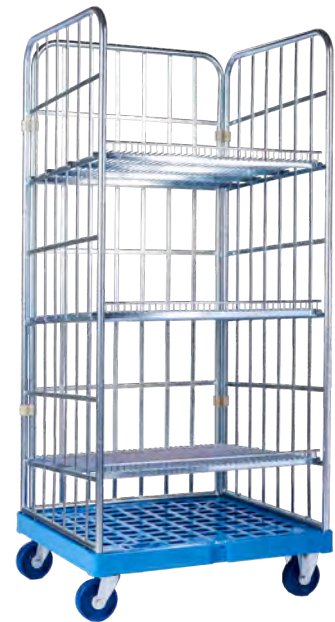
Rollregal mit geöffneter Langseite

– Beste Ladungssicherheit durch schräg eingesetzte Zwischenböden.